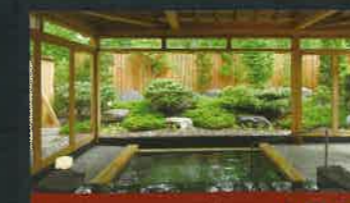
Auberge 別邸 山風木

全館使用榻榻米走廊的和風裝潢,以及當季時令的料理,寧靜氛圍的空間,魅力十足。 總客房數/10間 總容納人數/30名 http://daicyu.com/