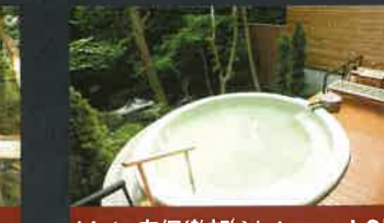
Yuto森俱樂部 (Yutomori Club)

在廣大的旅館用地內,備有18間的獨立客房和4個包租的單間露天溫泉浴池。 總客房數/18間 總容納人數/42名 http://www.ichinobo.com/daikon-no-hana/