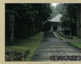
■平泉 中尊寺(岩手縣)