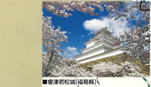
■會津若松城(福島縣)