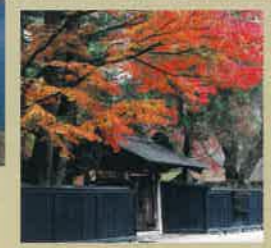
■角館武家屋敷(秋田縣)