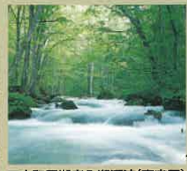
■十和田湖奧入瀨溪流(青森縣)